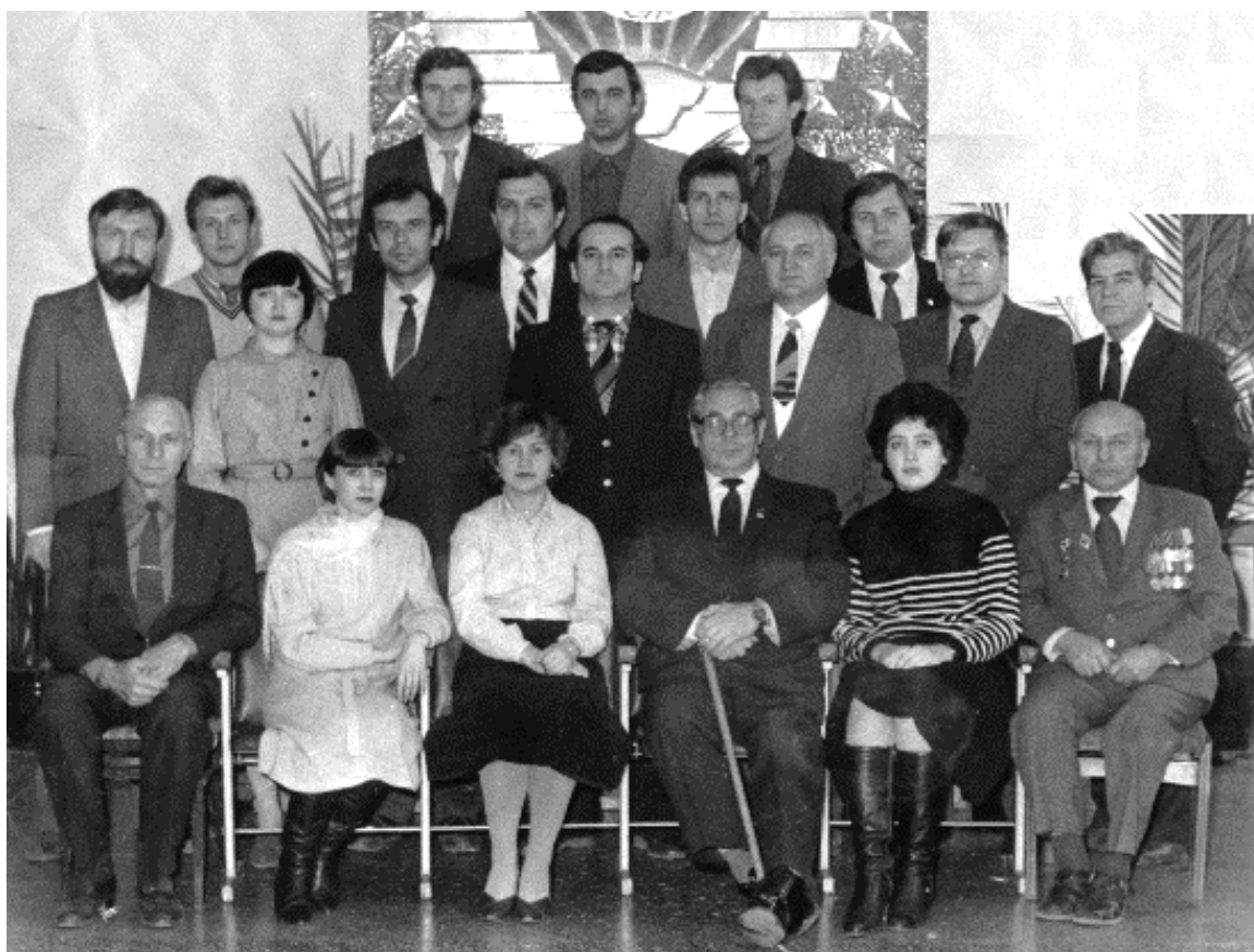
Коллектив кафедры ОМД в 1987 году.