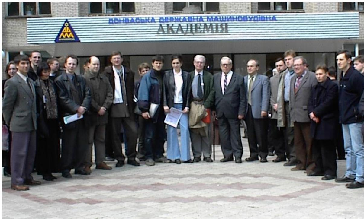
Учасники міжнародної науково-технічної конференції в 2004 році