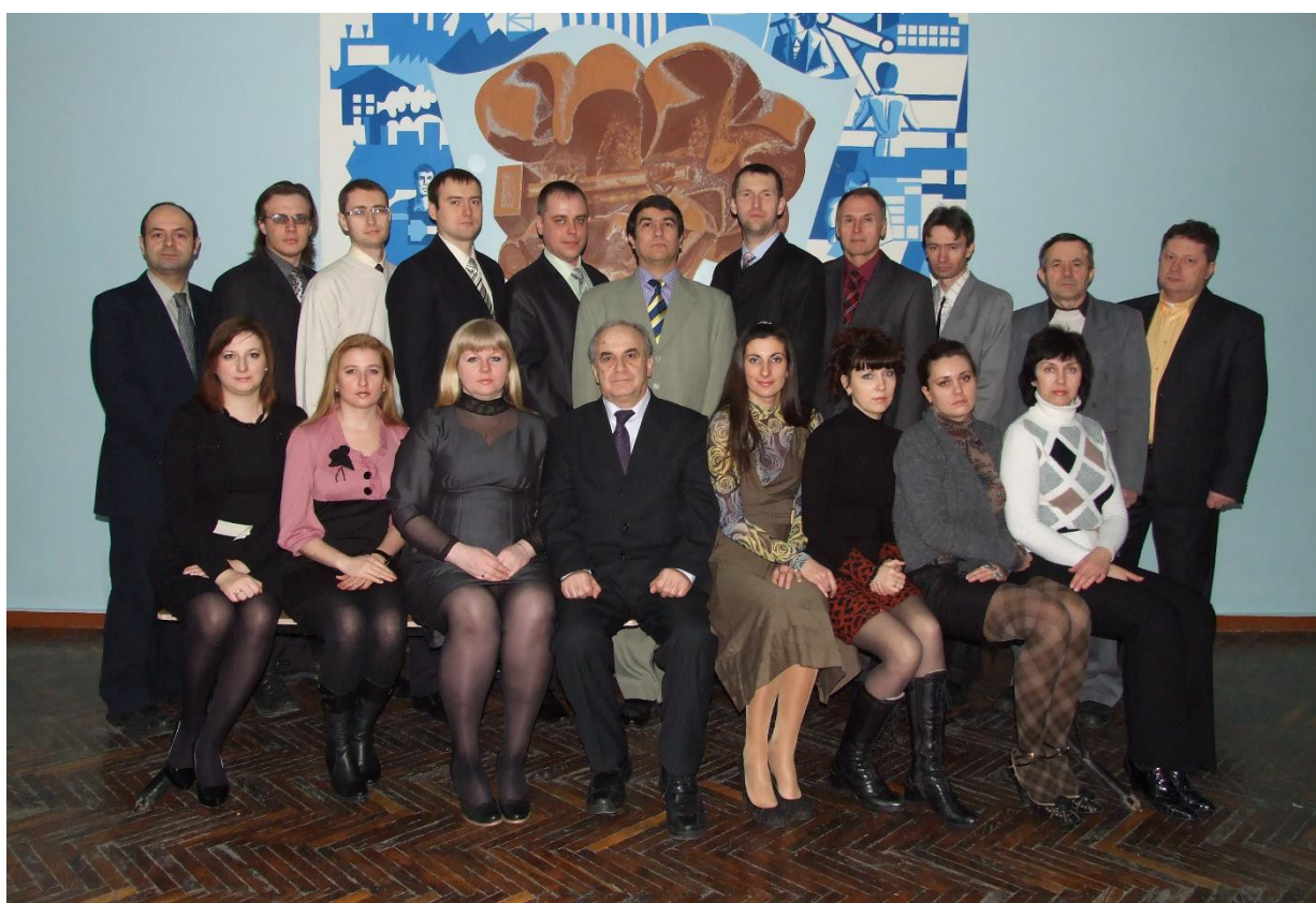
Коллектив кафедры ОМД в 2012 году.